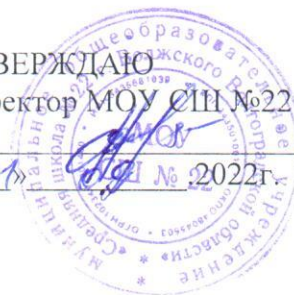
График работы школьного спортивного клуба «Эрон» на 2022/2023 учебный год